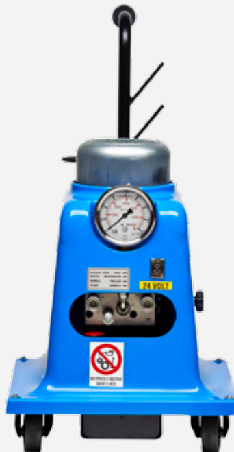
POWER UNIT STP-SERIES

Easy to adjust versatile torque. Simplicity of use. The power units guarantee to the wrench a perfect repeatability of torque and closure of each nut with the same power thanks to the Dynamometric Control system.