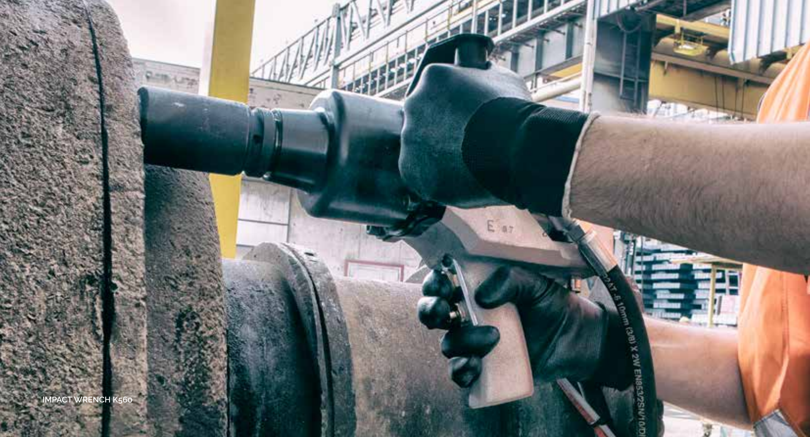
IMPACT WRENCH K660