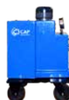
CENTRALINA BTP POWER UNIT BTP