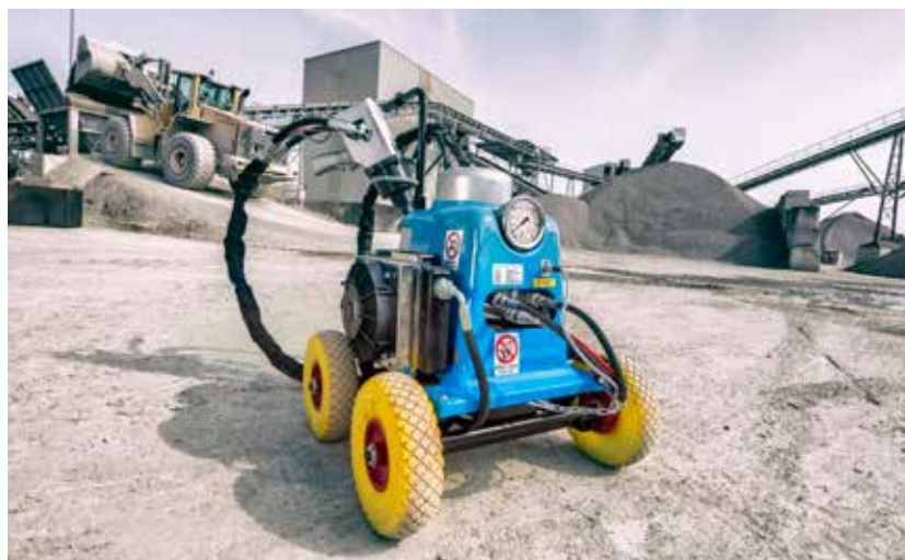
CUSTOMIZED STP POWER UNIT