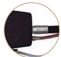
B = Posteriore Back