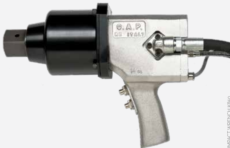
IMPACT WRENCH K850

Powerful and fast. Accurate and efficient. To offer you a reliable, resistent and flexible clamping solution for maintenance and industrial production.