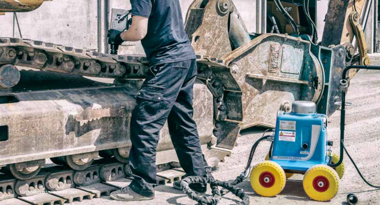
CUSTOMIZED STP POWER UNIT