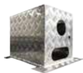
AB | AB COFANO IN ALLUMINIO MANDORLATO ALUMINUM BOX