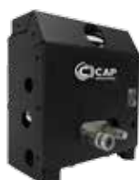
CENTRALINA MFD POWER UNIT MFD